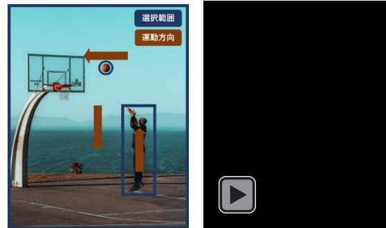
図6 作例1：バスケットボール