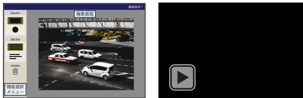
図2 提案ツールのインタフェース 左：静止画 右：出力動画 (Adobe Acrobat DC で視聴可)