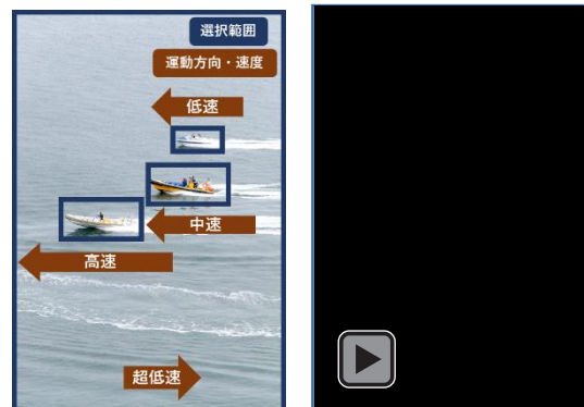
図7 作例2：ボートレース