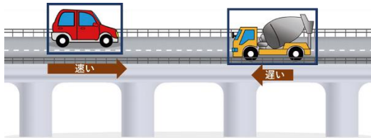
図5 領域・方向・運動速度（運動速度自由モードのみ）の複数選択例

これらの領域選択は、同画像内で複数選択可能である。また運動方向についても領域ごとに設定可能である。運動速度は、機能選択メニューで運動速度を自由モードにしている場合、それぞれの領域で変更可能である（図5）。